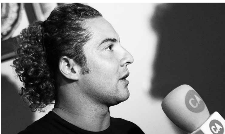
■ David Bisbal, atendiendo a los micrófonos de Canal Almería tras la cena.