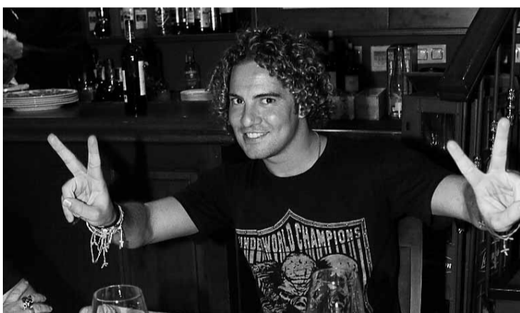
■ El almeriense derrochó buen humor durante toda la noche.