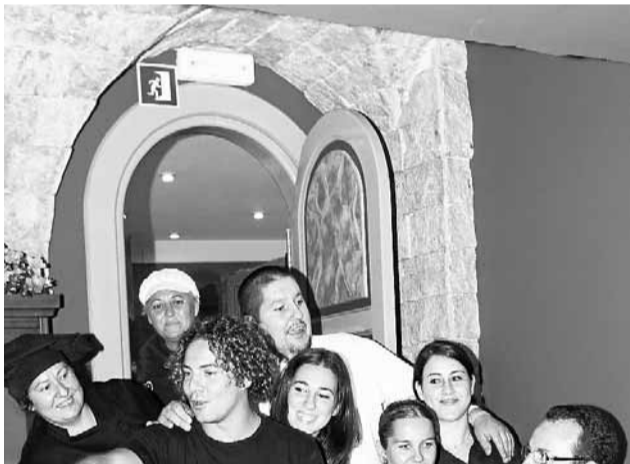
■ David Bisbal, con el magnífico equipo de Casa Sevilla.