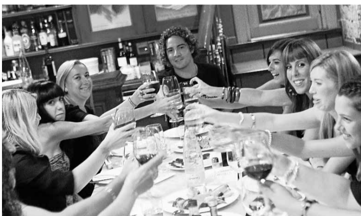
■ Brindis por una velada inolvidable.