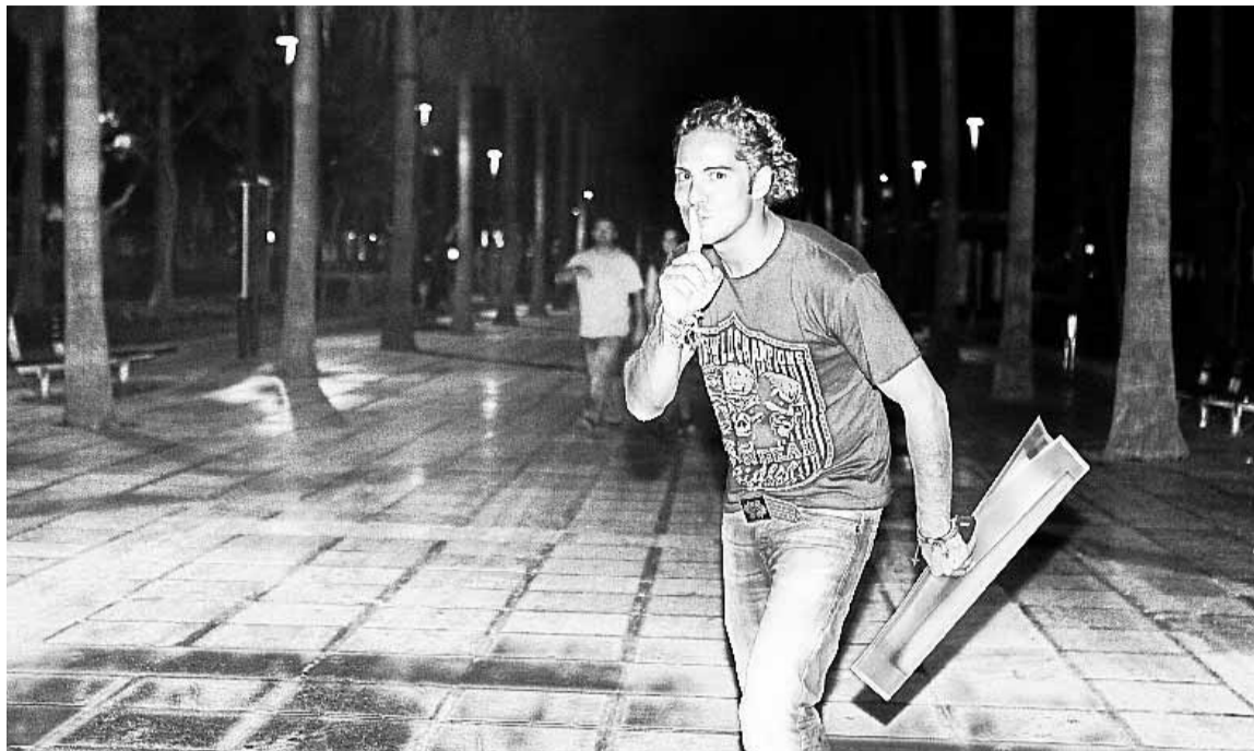
■ Bisbal pudo pasear por el centro de su ciudad, algo poco habitual desde que es tan famoso y de lo que no se tenía foto.